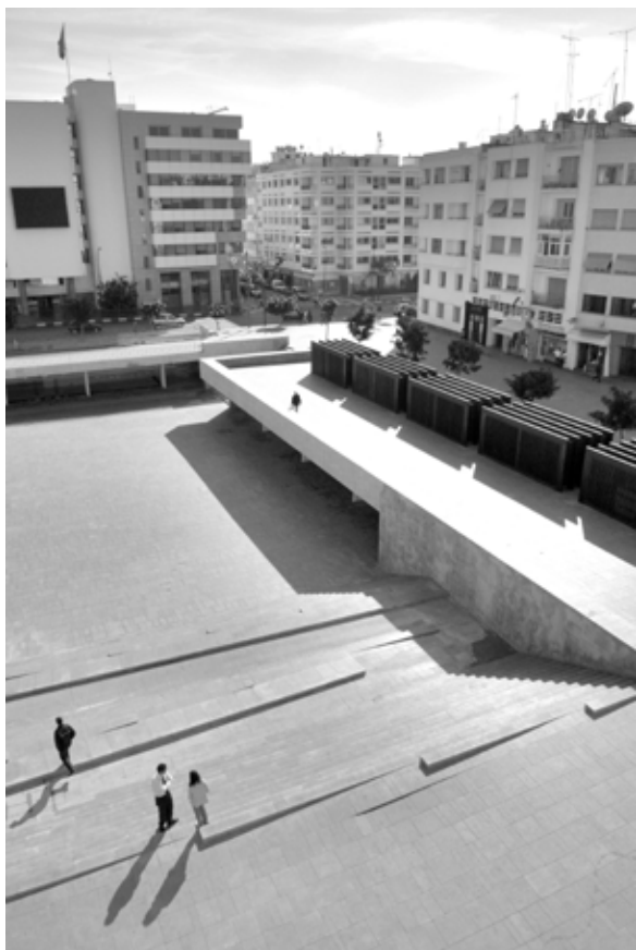
Place Pietri