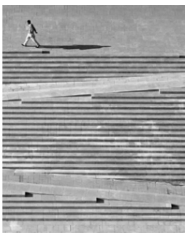
Place Pietri