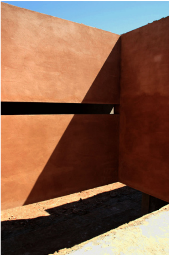
Asni Co-Habitation © kilo

De l'épaisseur d'une pièce, les maisons sont fabriquées comme un chapelet de pleins et de vides qui invite la ferme à traverser l'espace domestique. Cette structure territoriale remet en cause les codes de la domesticité. Les seuils entre le public, le commun, le privé et l'intime, n'existent plus uniquement dans un rapport à l'avant et à l'arrière, mais se résolvent de manière graduelle le long de la ligne.