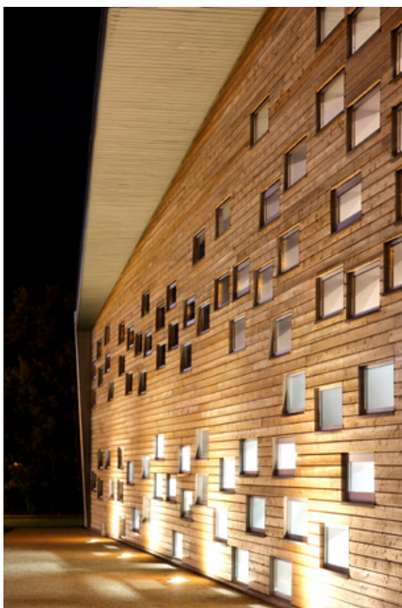
Virage de Mulsanne

Client: Société d'Aménagement de Mulsanne